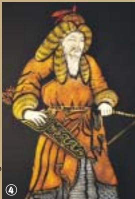
Maison guillaume de Rubrouck.

Son œuvre se poursuit aujourd'hui grâce à l'exposition, dans le musée, qui lui est dédié, d'une maquette représentant une yourte de Mongolie, dans le cadre du jumelage de la commune avec le village de Bulgan, sur les Monts Altai. Et, comme pour honorer la mémoire de cet ethnologue avant l'heure et en raison de la qualité de son patrimoine architectural, le village de Rubrouck est classé comme l'un des 100 villages typiques de France.