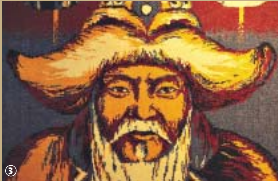
Maison guillaume de Rubrouck.

Comment Rubrouck, ce « marais broussailleux » peut-il être connu jusqu'au fin fond de l'Asie ? La réponse est dans le croquis et la foi d'un moine franciscain, nommé Guillaume, né vers 1220, missionné par Saint-Louis pour évangéliser la Mongolie. Le 7 mai 1253, il part de Constantinople pour débarquer en Crimée ; le 22 juillet il traverse Don, franchit l'Oural, les Monts de l'Altai et parvient en Mongolie. Le 27 décembre, il rencontre le Grand Khan, empereur de Mongolie, qui régnait alors