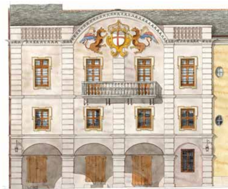
Projection de la façade des Noble Douze rénovée

→ Rénovation de la façade des Nobles Douze ✓ démarrage des travaux en 2021